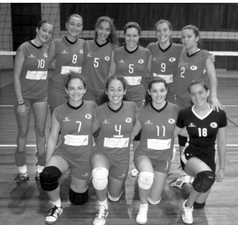
Clube Kairós - Juniores Femininos

Decorridos 10 dos 12 jogos planeados no presente campeonato de ilha no escalão de juniores femininos, o Clube Kairós sagrou-se campeão no passado dia 02 de fevereiro, depois de um jogo muito equilibrado com o Volei Clube de São Miguel. Com o pavilhão repleto de gente, estas duas equipas proporcionaram um brilhante espetáculo desportivo, demonstrando ao longo dos três sets esta-