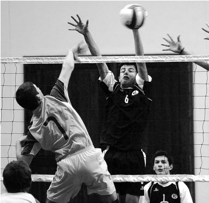
Cortes às Associações Desportivas, marcam o presente e futuro do Voleibol

É no mês de julho que as Associações de Voleibol dos Açores, se reúnem para definir as estratégias a implementar na nova época desportiva, fazendo-se um balanço dos campeonatos da II divisão - Zona Açores e campeonatos regionais dos diferentes escalões. Nesta reunião são igualmente nomeadas as associações responsáveis pela Comissão de Arbitragem Regional (atualmente AVSM - São Miguel), a Associação Gestora dos Quadros Competitivos (atualmente AVIT - Terceira) e a Associação responsável pela participação das Seleções Açores nos